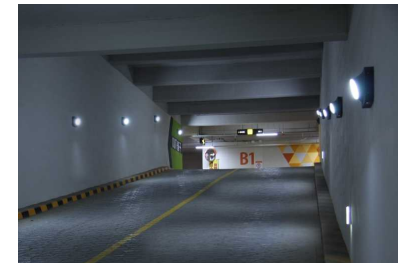
서울, 아현3구역 레미안, 푸르지오

Energy Saving 74% LED 40W vs Metal halide 150W